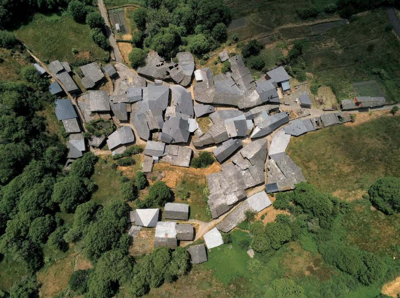
O Carballal a vista de dron a finais da primavera