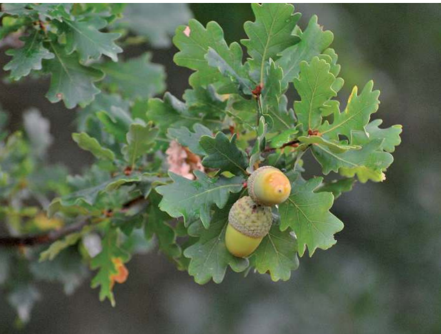
Landras nun rebolo, rebola ou reboleira ( Quercus pyrenaica ) [SG-2017]

Folgo do Courel, A Pobra do Brollón, O Incio e Samos; o Alto do Pico (1.181); O Cornán; ou o Boi Branco (1.024), xa en descenso. Na parte oeste, entre a aldea e as montañas, existe outro arco interior que tamén a protexe, coa Campa Vella, preto dos 940 metros de altitude, e o Alto do Cabezón (986). Cara ao sur, como xa dixemos, abre o val, destacando no horizonte próximo a mítica Pena de Corvos (843 m), a chamada montaña do Lor e o val do río Sil, e chegan incluso a divisarse ao lonxe as altas serras da provincia de Ourense.