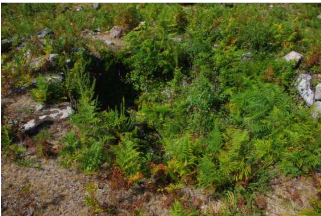
Pozo cuberto de vexetación

Presenta un estado de conservación moi ruinoso, cunha alta porcentaxe das paredes que converxen no buraco en estado vestixial e practicamente desaparecidas no tramo final da converxencia co pozo. O buraco é a parte mellor conservada da estrutura cinxética, coa súa armazón practicamente intacta, lementando só a presenza no seu interior dunha densa capa de vexetación e dalgunhas pedras do derrume superior do mesmo.