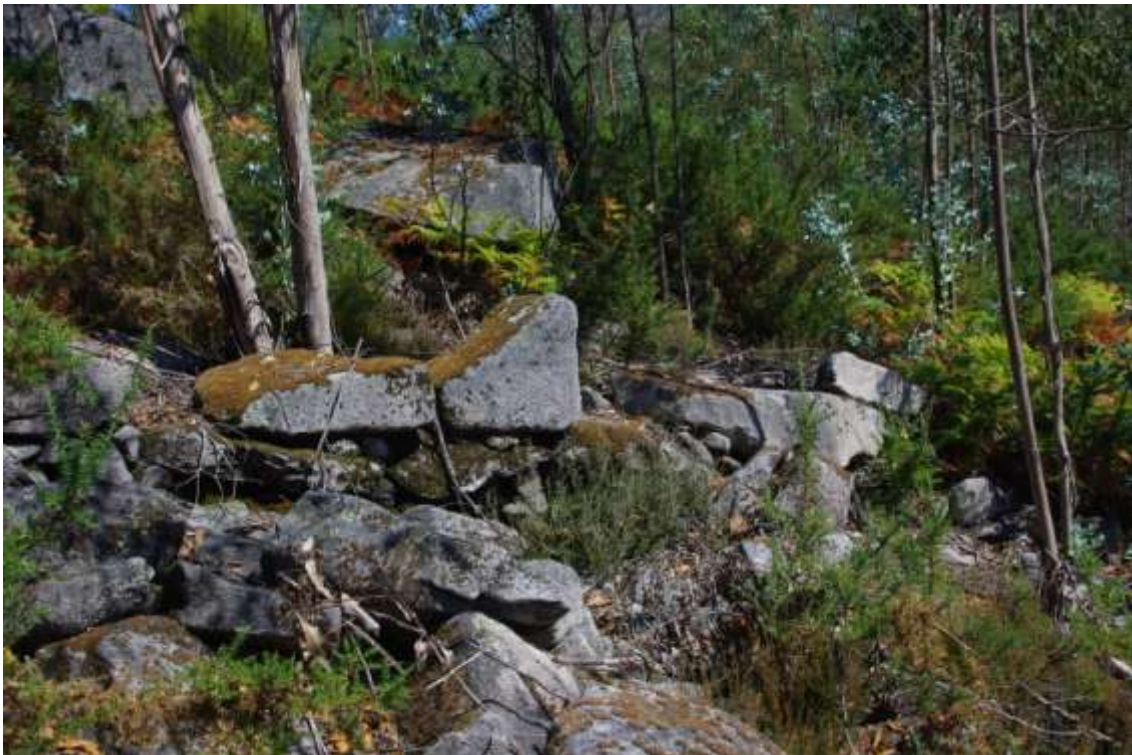
Detalle construtivo da parede norte

A parede sur mide 126 m e está moi deteriorada, non conservando ningún alzado completo do paramento pétreo e polo tanto, ningunha das capeas que recubrían a parte superior dos muros. Na zona chaira máis cercana ao pozo, o seu estado é case vestixial, con zonas nas que está completamente arrasado, conservando restos do seu paramento na parte superior da ladeira que ascende ao cumio, onde remata a parede. O muro norte mide 134 m, estando tamén totalmente arrasado na zona cercana ao buraco e conservando dúas-tres fiadas do seu paramento na ladeira que ascende ao cumio. Esta vertente está densamente cuberta de vexetación, e oculta o volume de derrume do muro que nalgunos tramos chega a conservar un metro de altura. Temos que precisar que no caso desta sebe, a súa mensuración é aproximada, dado que a densa vexetación, non permite comprobar se continua polo cumio seguindo o afloramento rochoso.