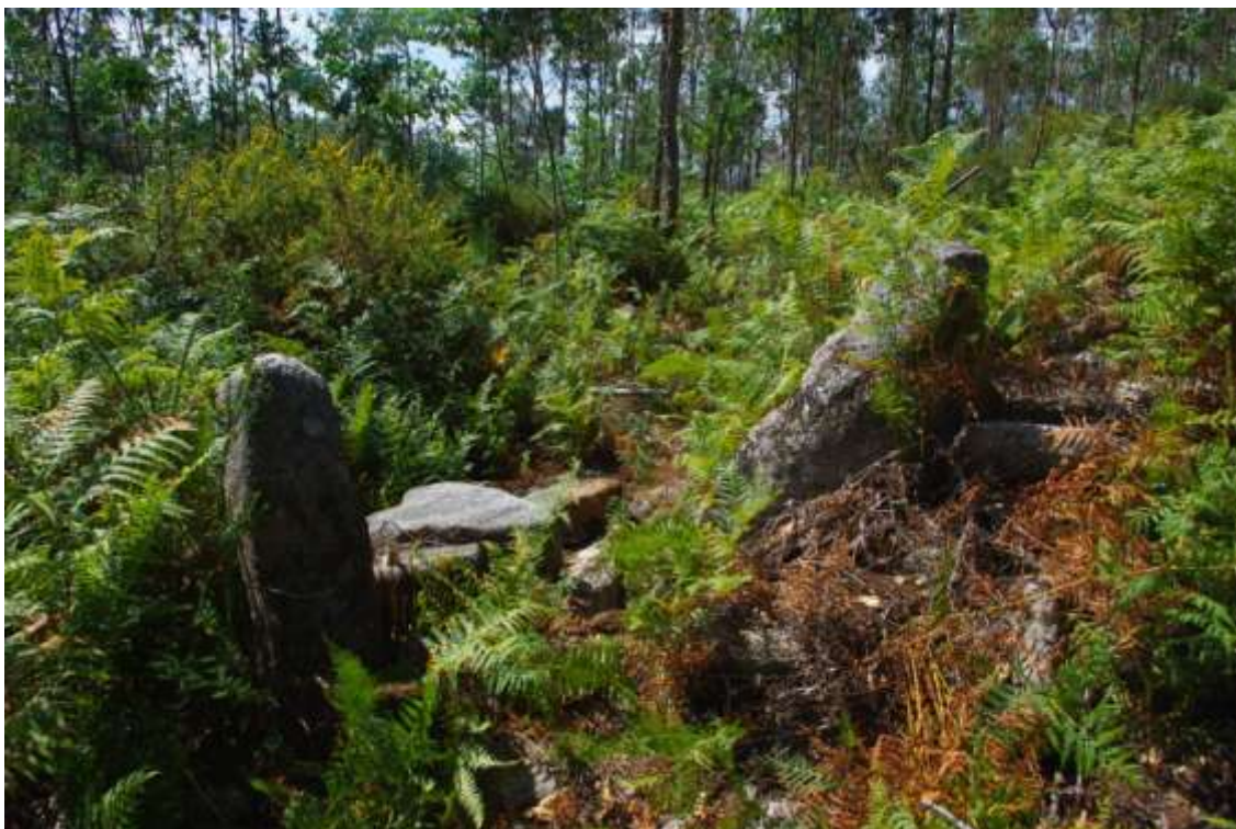
Restos da parede co boquete

que durante a batida sería tapada cunha cancela de madeira e permitía entrar ou saír aos monteiros do interior da trampa.